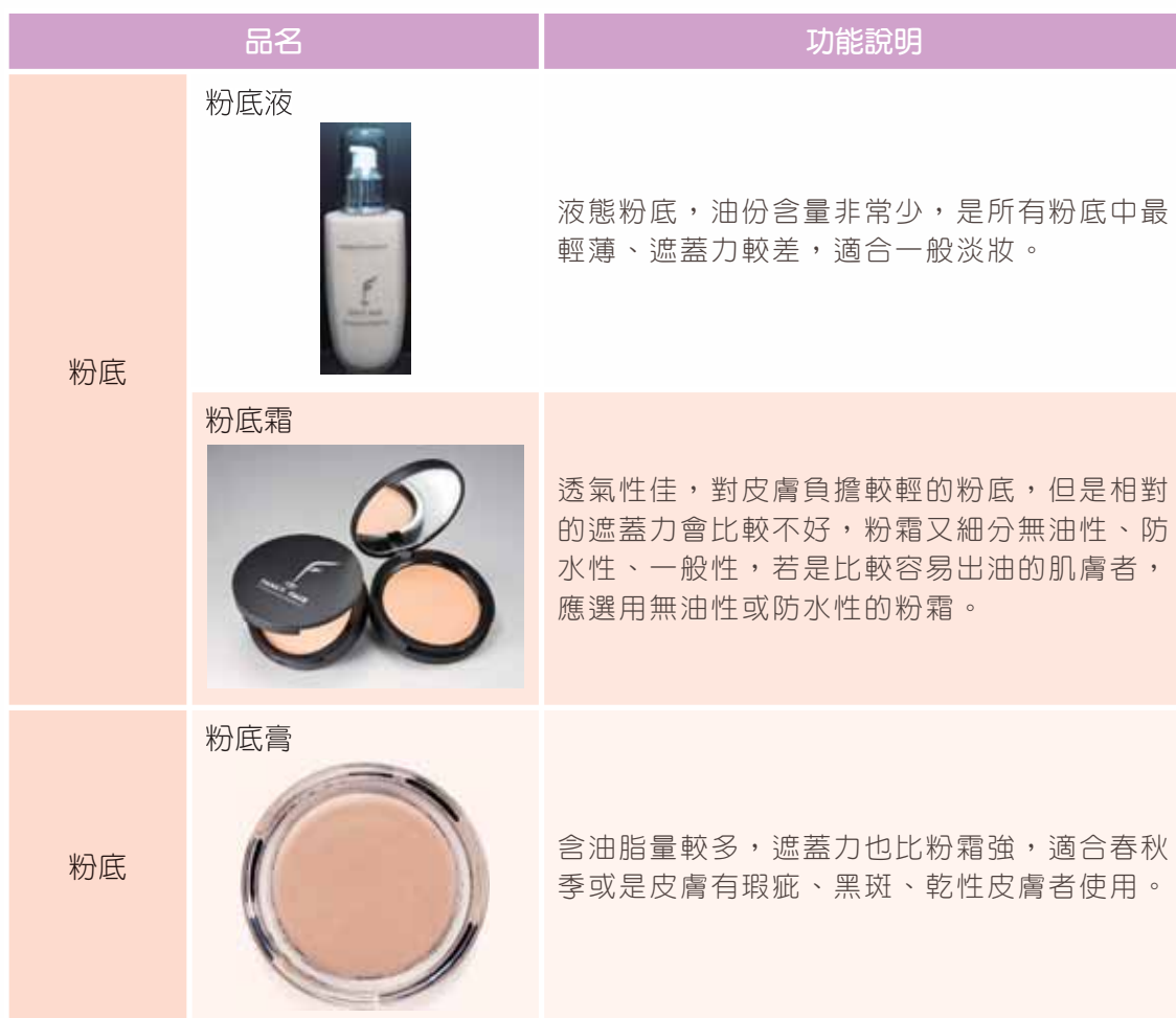
表 2-7 彩妝種類