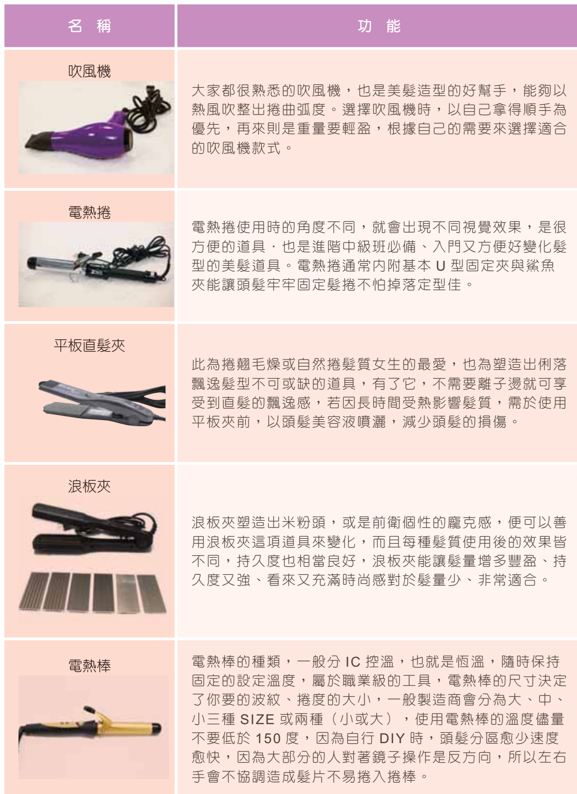
表 2-1 美髮用具介紹