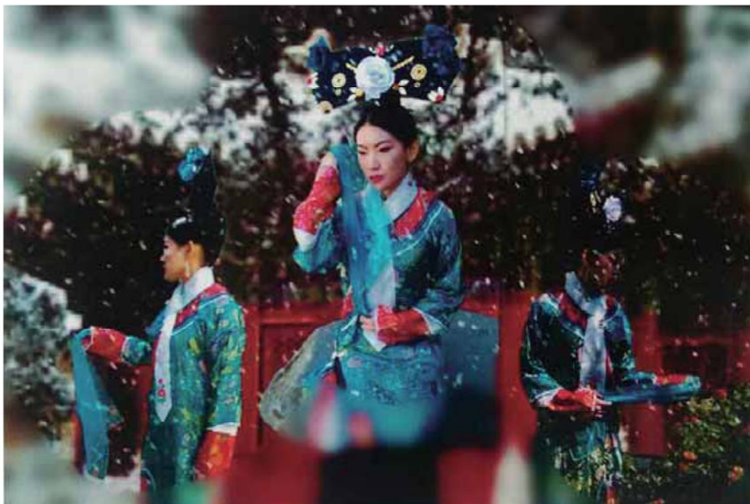
學生作品 2 《清宮深怨》宣傳海報劇照