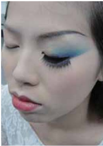
4 為凸顯角色的權位與霸氣，眼影可採往後拉長的效果，唇形以縮小的唇型為主要。如上頁的嘴型圖