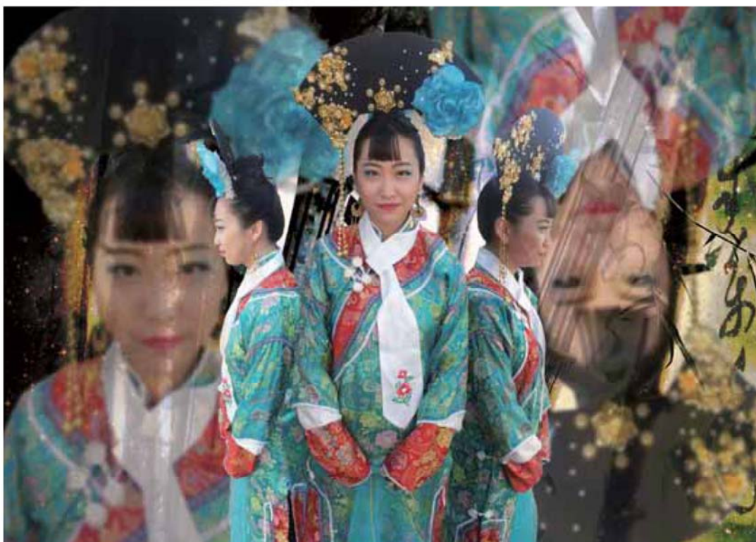
學生作品 1 《楓若依華》宣傳海報劇照