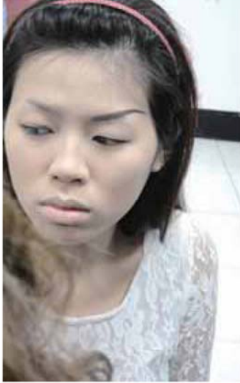
1 打上略白的粉底，眉型可以彎月、斜長或淡淡的遠山眉為主