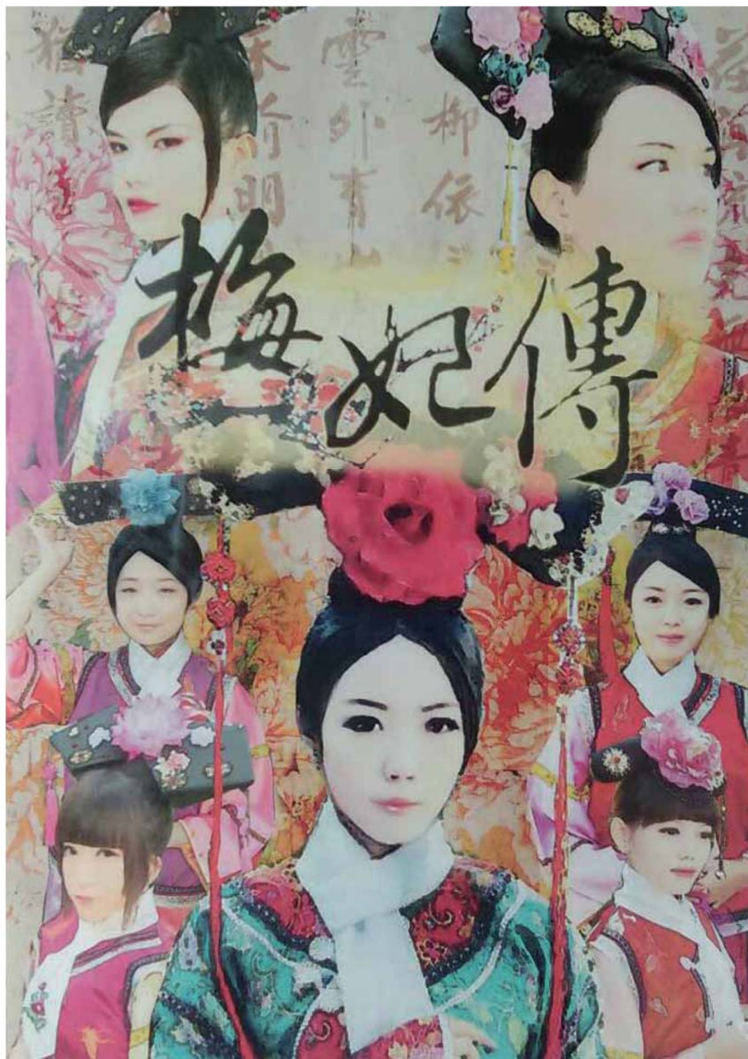
學生作品 4 《梅妃傳》宣傳海報劇照