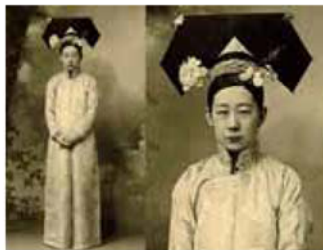
圖 5-1 清朝大拉翅旗頭

「大拉翅的表面可以插絹花、簪、釵、珠花、鑲飾」、寶玉等裝飾物，側面有時也懸掛著流蘇。「大拉翅」的固定使用時以扁簪固定在頭上，不用時可取下，所以每位愛美的清朝婦女，皆有許多的髮型上的造型物件「大拉翅」。清朝化妝崇尚的是膚色偏白的底妝，眉型從柳月、遠山眉、彎月、斜長型…等眉形均為婦女們喜好，脣形以縮小的櫻桃小唇形為主要，腮紅大多以斜紅妝，但為考量現代人觀看影視的喜好往往會與當代的流行趨勢融合，所以，造型上時有現代感的妝容融入其中。