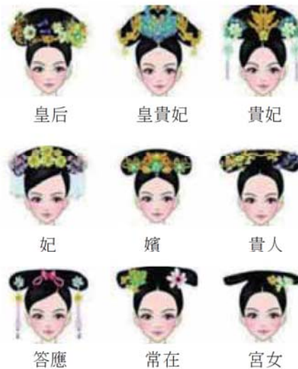
圖 5-2 清朝後宮嬪妃大拉翅形式