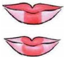
圖 5-3 清朝化妝嘴型縮小圖