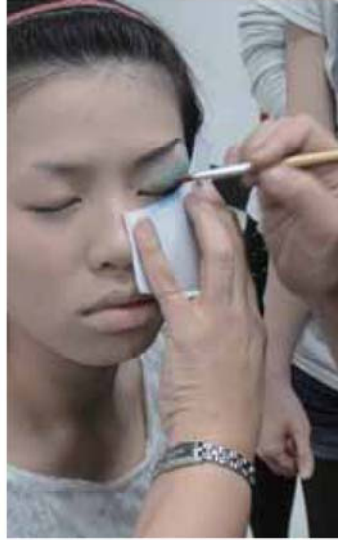
2 用藍色與深藍色與黑色眼影漸層畫上眼影約上眼皮至眉毛下緣約 3/1 的高度即可。