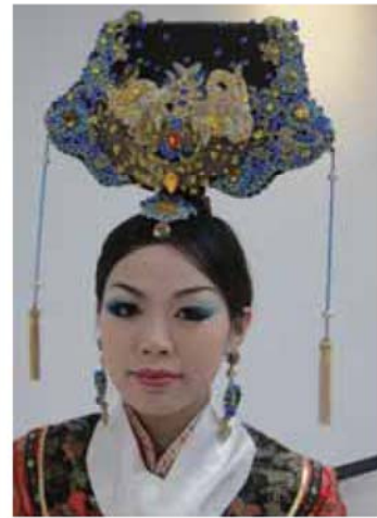
6 完成造型與髮妝設計