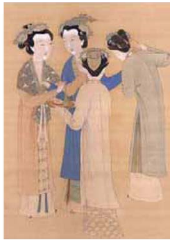
5 清朝流行的三白妝所以在額頭鼻樑以及下巴刷上白色（可依歷史考據或現代影視版方式呈現依劇情需求）